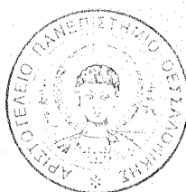
ΒΑΪΟΣ ΧΑΡ. ΜΠΑΜΠΛΕΚΗΣ

ΠΙΣΤΟ ΑΝΤΙΓΡΑΦΟ από το πρωτότυπο με εντολή του Πρύτανη Ο Προϊστάμενος του Πρωτοβουλίου - Διοίκησης